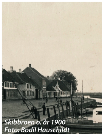
Skibbroen o. år 1900