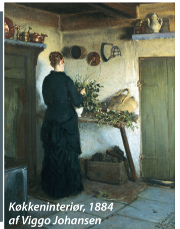
Køkkeninteriør, 1884 af Viggo Johansen